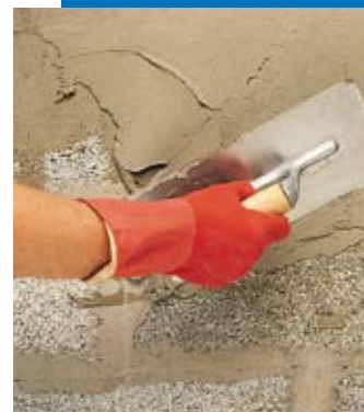
Application à la spatule