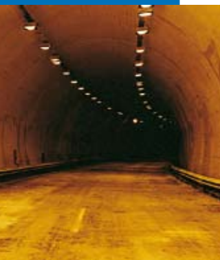
Idrosilex Pronto blanc dans le tunnel