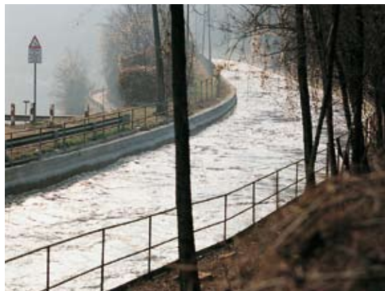
Canal Bertini - Robbiate (CO) impermeabilisé avec Idrosilex Pronto