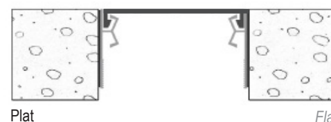
Cornières invisibles collées ou fixées mécaniquement avec insert lisse Invisibly glued or mechanically fixed aluminium side plates with smooth insert