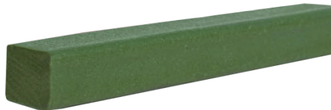
BENTOBAR 20 x 25 mm

Les joints hydrogonflants sont des éléments essentiels dans le domaine du bâtiment pour assurer l'étanchéité des structures en béton, notamment aux points sensibles tels que les joints de construction, les reprises de bétonnage et les passages de gaines ou de tuyaux. Ils sont conçus pour gonfler au contact de l'eau, comblant ainsi les interstices et empêchant les infiltrations.