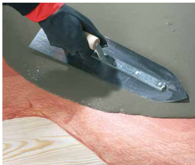
Associé au ragréage fibré RAGRENOV S30 ou RAGREFOR - pose sur bois

Ce document technique peut faire l'objet de mise à jour, il est de la responsabilité de l'utilisateur de contrôler systématiquement si une version plus récente est disponible sur notre site www.cermix.com . Il est de la responsabilité de l'applicateur de contrôler la compatibilité et l'adéquation des produits pour la réalisation des travaux. Des essais peuvent être réalisés au préalable pour valider le bon comportement des produits.