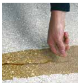
4 : Sabler à refus