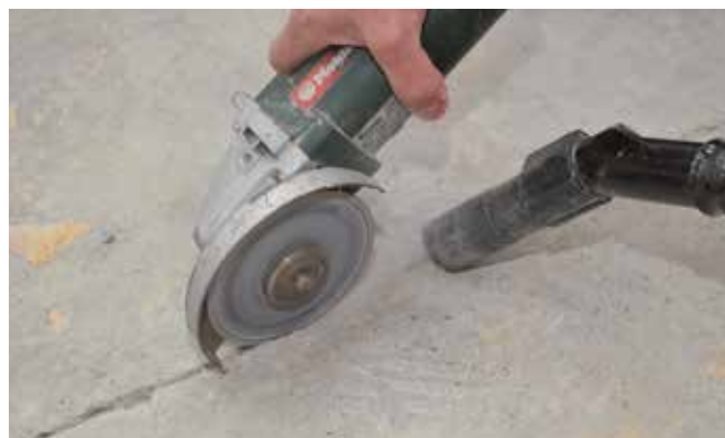
1 : Ouvrir la fissure