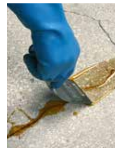
3 : Spatuler à zéro