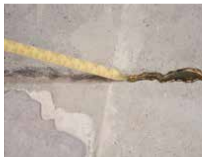
2 : Comblent la fissure