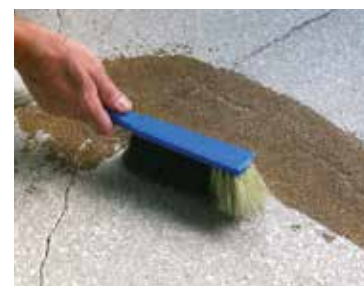
5 : Nettoyer le sable

Ce document technique peut faire l'objet de mise à jour, il est de la responsabilité de l'utilisateur de contrôler systématiquement si une version plus récente est disponible sur notre site www.cermix.com . Il est de la responsabilité de l'applicateur de contrôler la compatibilité et l'adéquation des produits pour la réalisation des travaux. Des essais peuvent être réalisés au préalable pour valider le bon comportement des produits.