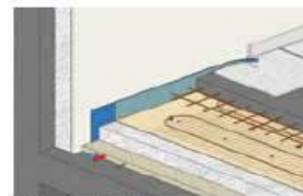
Plancher chauffant électrique