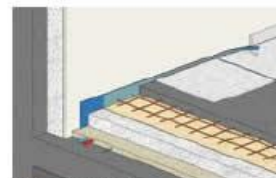
Mortier de scellement