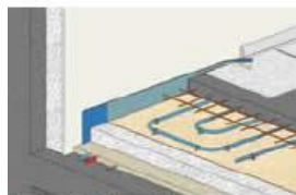
Plancher chauffant eau chaude